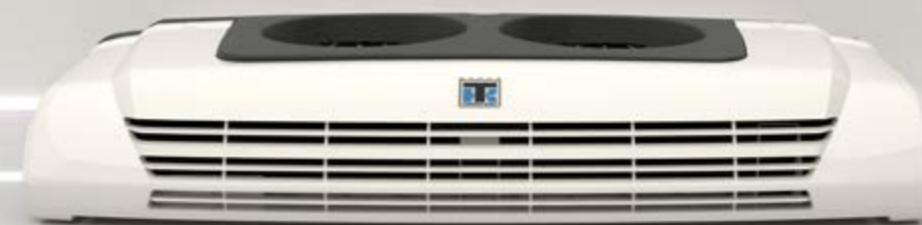
C-450 — C-750