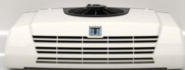
C-150 — C-350