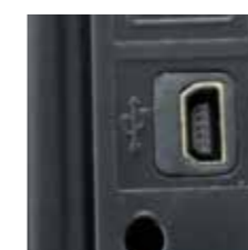
Детальный вид USB-подключения