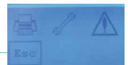
Детальный вид сенсорного экрана