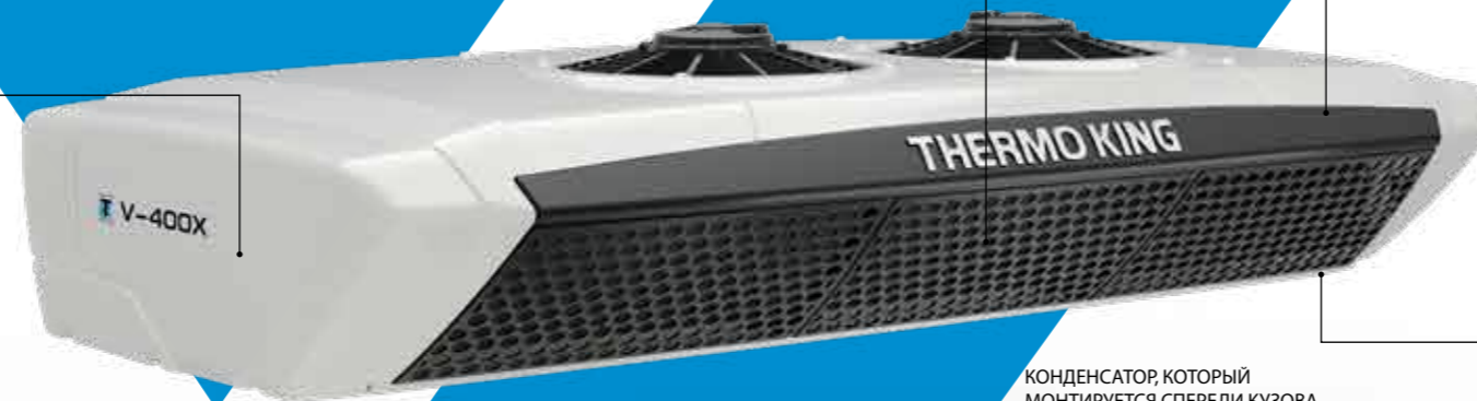
КОНДЕНСАТОР, КОТОРЫЙ МОНТИРУЕТСЯ СПЕРЕДИ КУЗОВА