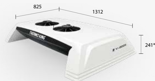
V400X/500X/600X (МОНТИРУЕТСЯ НА КРЫШЕ)

* Указанная высота является высотой корпуса. Высота, включая вентиляторы: монтаж спереди кузова — 276 мм, монтаж на крыше — 273 мм