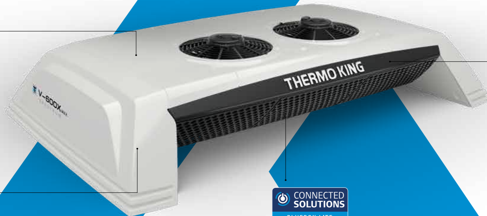
КОНДЕНСАТОР, КОТОРЫЙ МОНТИРУЕТСЯ НА КРЫШЕ