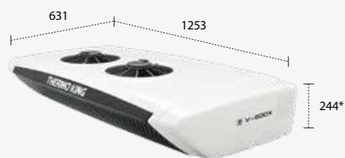
V400X/500X/600X (МОНТИРУЕТСЯ СПЕРЕДИ КУЗОВА)