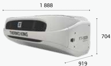
T-1200R WHISPER™ PRO/ T-1200R SPECTRUM WHISPER™ PRO