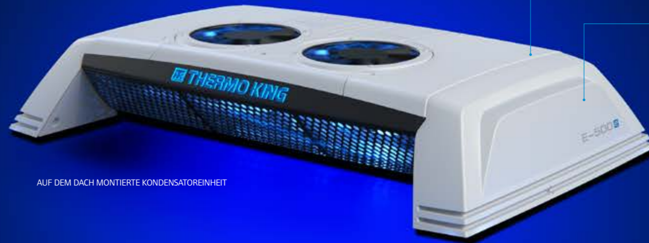
AUF DEM DACH MONTIERTE KONDENSATOREINHEIT

EINE VIELSEITIGE KÜHLLÖSUNG – DIE BEV-ANTWORT AUF INNERSTÄDTISCHE BEGRENZUNGEN.