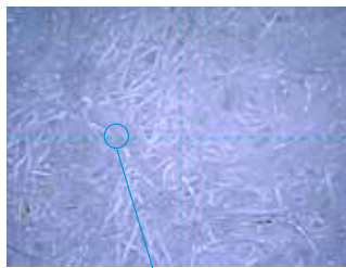
Maglia del filtro Thermo King

La maglia brevettata di Thermo King cattura il 60% di particelle in più, mantenendo così il refrigerante e l'olio puliti, prolungando il ciclo di vita del compressore.