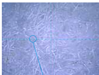
Набивка фильтра компании Thermo King

Набивка фильтра компании Thermo King захватывает на 60 % больше частиц, так что хладагент и масло поддерживаются в более чистом состоянии, а это приводит к увеличению срока службы компрессора.